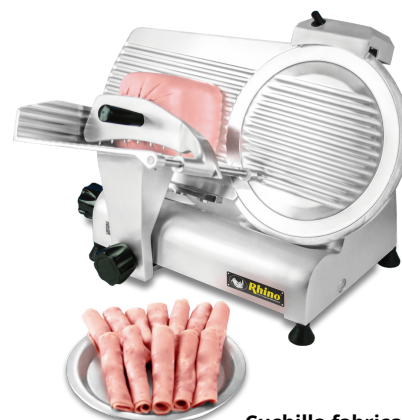
Cuchilla fabricada en Italia